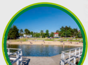
ZALEW SIEMIATYCZE Z INFRASTRUKTURĄ / WATER RESERVOIR IN SIEMIATYCZE WITH INFRASTRUCTURE