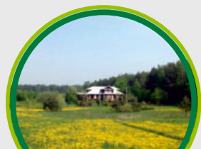
ALPAKARIUM RUDKA / ‘ALPAKARIUM’ RUDKA