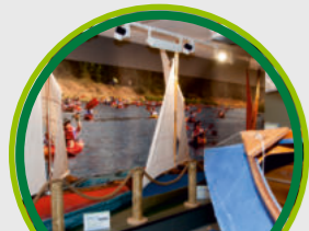
NADBUŻAŃSKIE CENTRUM TURYSTYKI KAJAKOWEJ / THE CENTRE OF KAYAK TOURISM