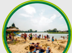
ZALEW ŁOSICKI Z LICZNYMI ATRAKCJAMI / WATER RESERVOIR IN ŁOSICE WITH NUMEROUS ATTRACTIONS