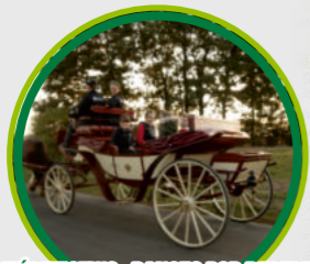
JEŹDZICTWO „RANCZO POD DEBEM” / THE ‘OAK RANCH’ HORSE RIDING