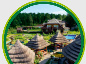
ZIOLOWY ZAKATEK: ZAGRODA EDUKACYJNA, PODLASKI OGROD ZIOLOWY / THE HERBAL CORNER: EDUCATIONAL FARM, HERBAL GARDEN OF PODLASIE