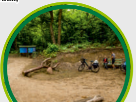
ZESPÓŁ PRZYRODNICZO-KRAJOBRAZOWY „GŁOGI” / GŁOGI NATURE AND LANDSCAPE COMPLEX